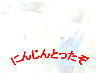
にんじんとつたぎ