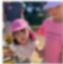
こあら組のお友だちが遊んでくれたよ☆