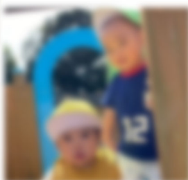
一緒にハイチーズ♪