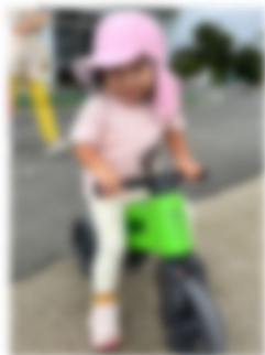
バイクに乗ってニコニコ☆