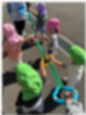
自分で持って歩けるよ♪