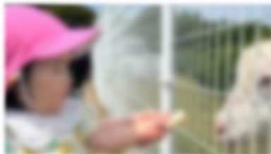
ヤギさん、ごはんどうぞ～！