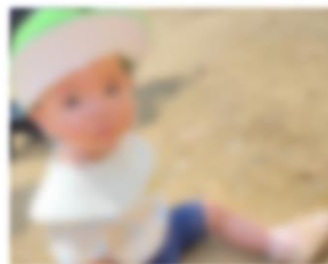
新しい靴を履いてお外遊び♡