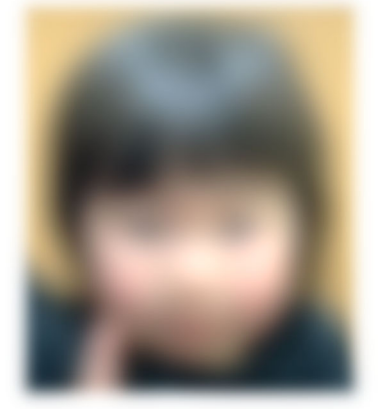
うさぎぐみ（1歳児クラス） ちゃん（1歳）