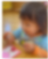
目のシールを貼るよ～♪