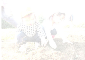
うんとこしょ〜 どっこいしょ〜